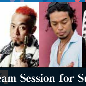
Dream Session for Sumida 2018